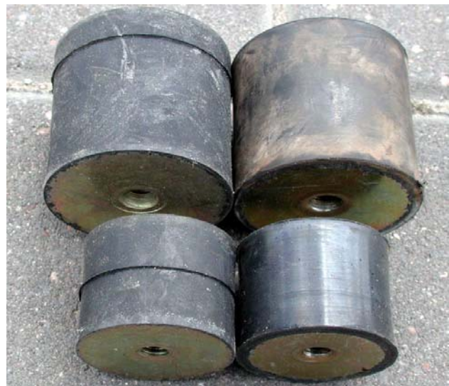
Puffer sicher (links), und unsicher (rechts)

Die Puffer Ø40xHöhe 30 werden am Motorträger des Flykes eingesetzt (je 4 Stück) und am Zylinderkopf und am Getriebe des Simonini-Motors (maximal 3 Stück, typischerweise nur 1x oben).